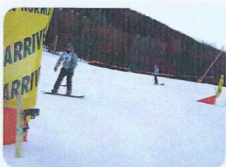
Épreuves sportives 2011, slalom de surf

Après avoir concouru à toutes ces épreuves, les différents départements TC se voient attribuer une note et une place dans le classement général.