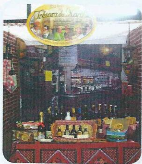
Le salon des produits régionaux 2011, l'estaminet