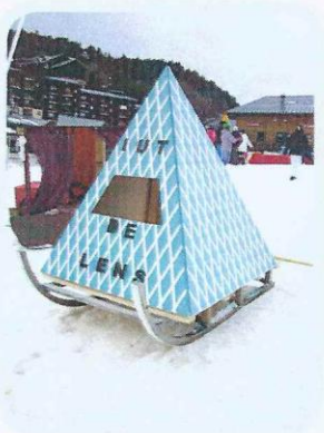
L'OGNI 2011, Le Louvre Lens

Cette épreuve consiste à mettre en application les connaissances et expériences acquises au cours du DUT à travers un cas réel.